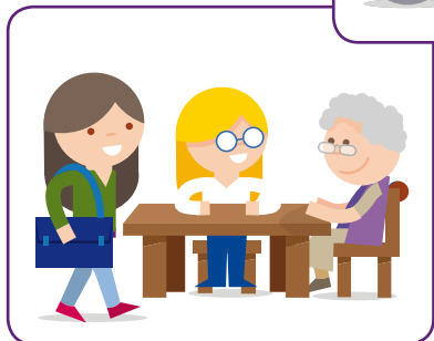
Mantelzorg wordt ondersteund