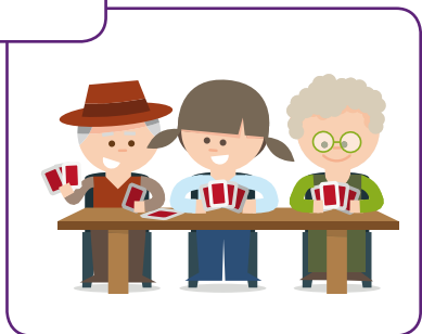
Clïënt wordt geactiveerd en doet mee