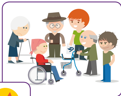
Netwerk rondom een clïënt vergroot